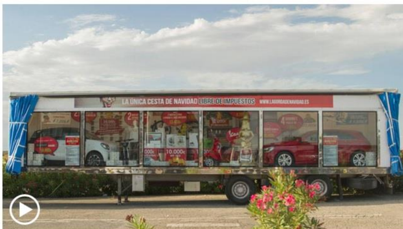
La Gorda de Navidad. Promoción de la macrocesta de Navidad COMPLEJO CASTEJÓN.