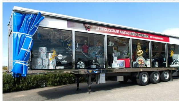
La cesta de premios recorrerá diversas ciudades