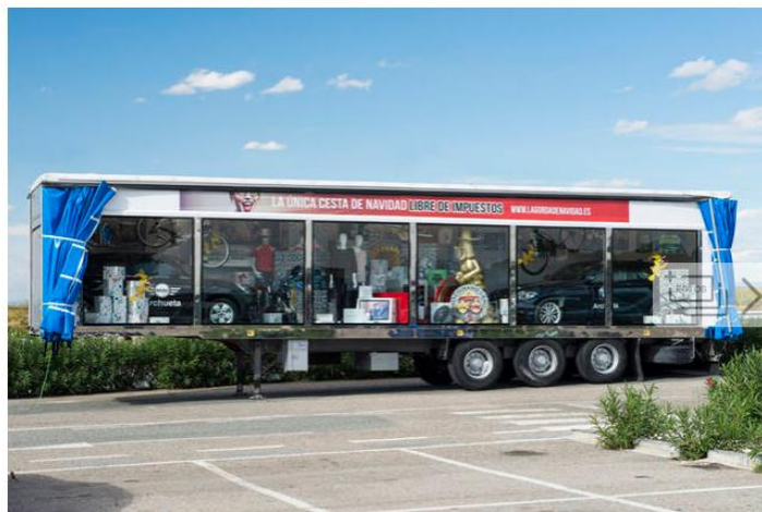
La cesta de 'La Gorda de Navidad' del Complejo Castejón.

La macrocesta del restaurante Mariano de Calamocho se ha hecho famosa en toda España por la gran cantidad de productos que tiene y por su valor, que este año supera los 400.000 euros. A esta cesta le han salido competidoras en todo el país, como 'La Gorda de Navidad' que organiza el Complejo Castejón, situado en la localidad navarra del mismo nombre.