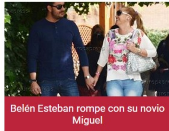
Belén Esteban rompe con su novio Miguel