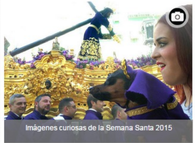
Imágenes curiosas de la Semana Santa 2015