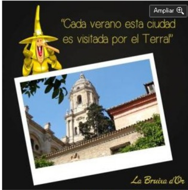
La primera pista publicada en Facebook.

Los comentarios están sujetos a moderación previa y deben cumplir las Normas de Participación