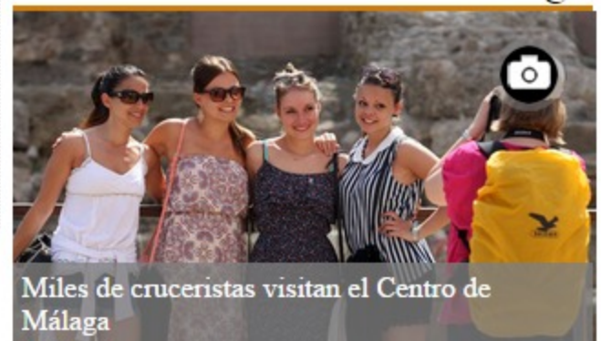
Miles de cruceristas visitan el Centro de Málaga