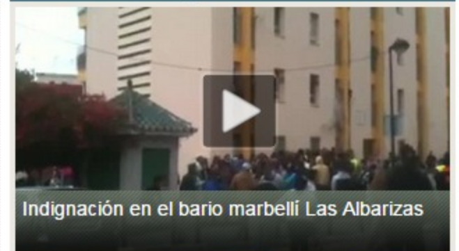
Indignación en el barrio marbellí Las Albarizas